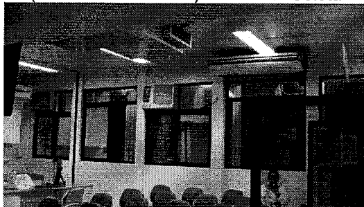
FIG 03 – Setor de Coleta, HEMOSC Coordenador