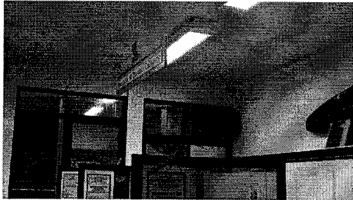
FIG. 01 - Remoção de equipamento 1 (Sinalizado com seta) – Setor de Coleta