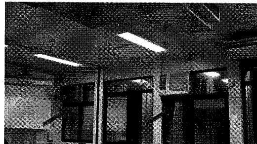
FIG.02 - Remoção de equipamentos 2 e 3 (Sinalizados com seta) – Setor de Coleta