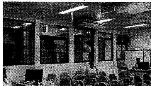
FIG 04 – Setor de Coleta, HEMOSC Coordenador