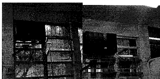
FIG. 07 - Remoção de equipamento 5 e 6 (Sinalizado com seta) – Setor de Ambulatório-Transfusão