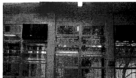
FIG 08 – Setor de Ambulatório-Transfusão, HEMOSC Coordenador